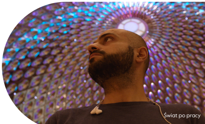
Świat po pracy